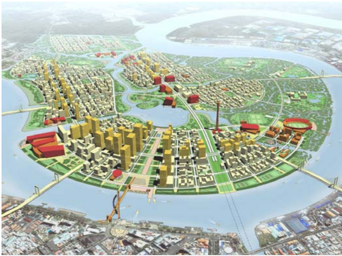
▲ Un projet urbain ambitieux.

T raditionnellement développée sur la rive droite de la Rivière Saigon, autour des quartiers français (Saigon), vietnamien (Gia Định) et chinois (Cho Lon), la Ville de Saigon, devenue Hô Chi Minh-Ville, tend à se développer tant vers le Sud (ville nouvelle de Nam Saigon ou Saigon Sud) que le Nord (Cu Chi, Hoc Mon).