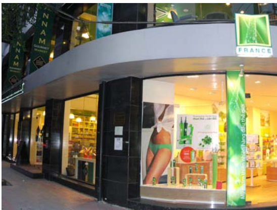
▲ Une forte présence des marques et produits français (alimentaires, cosmétiques, etc.).