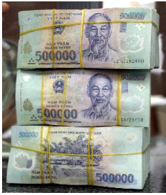
▲ Une économie encore peu bancarisée.